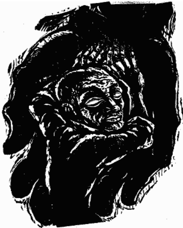
In manibus tuis.